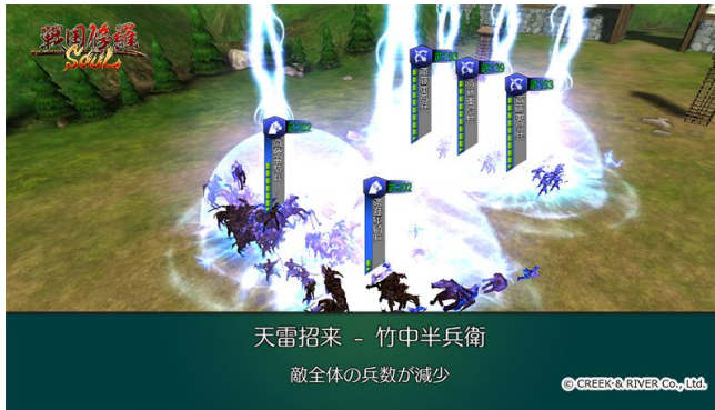
バトル画面 スキル発動中