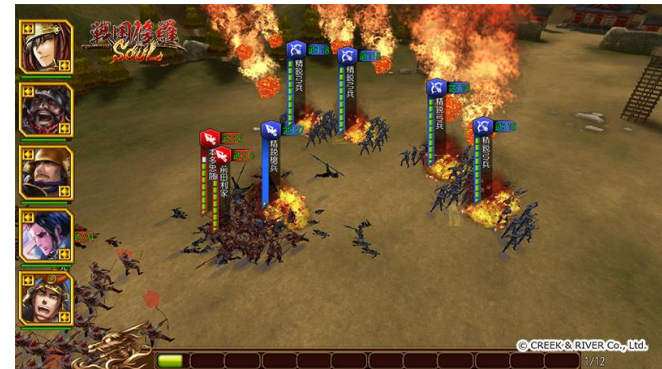
バトル画面 スキル発動中