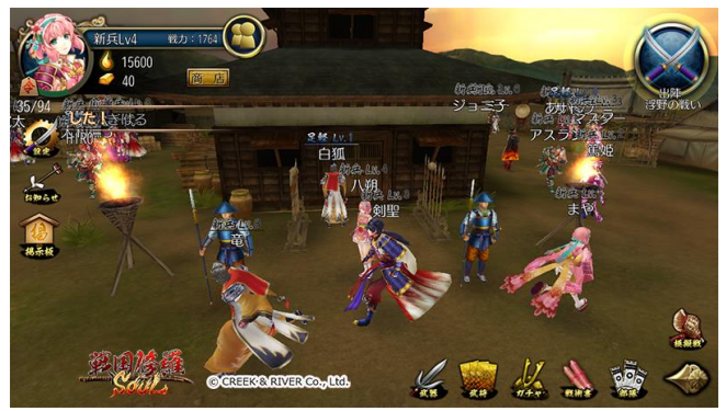
フィールドマップ画面