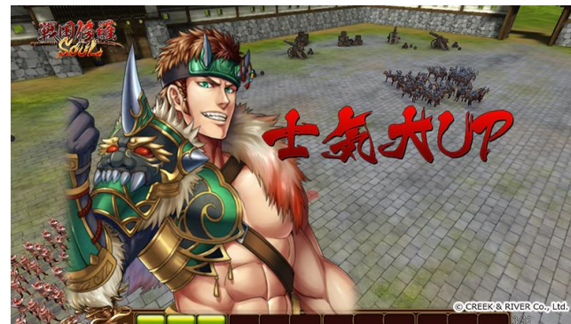
バトル画面 スキル発動開始