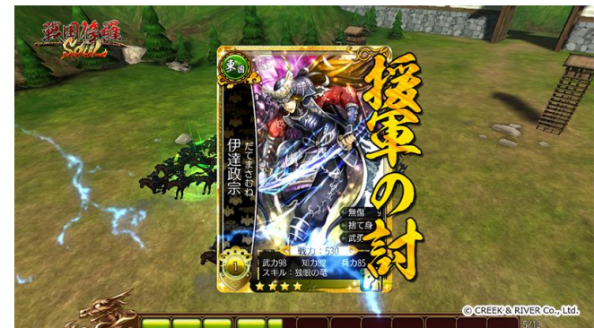
バトル画面 援軍スキル発動中

▼画像素材は下記サイトよりダウンロードできます http://xfs.jp/3vtNJK ※パスワードは「creek」