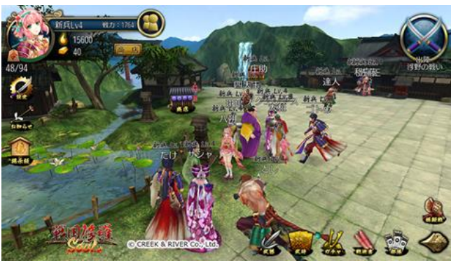
フィールドマップ画面