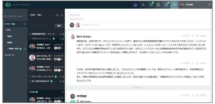
コミュニケーション機能