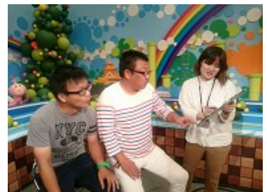
「駅前TVサタブラ」 打ち合わせの様子

東京で働いていた頃から、いずれ地元へ戻り、地域活性化や地域イベントの仕事に就きたいと考えていて、担当番組が終了したのを機にUターンしようと思いました。地域に根ざしたことをしたいと思っていて、旬の情報の取材をする中で、普通に暮らすだけでは出会えなかった、県内の人々やイベント、特産品を改めて知り、熊本の良さを再確認できました。4月の熊本地震から、県民一丸となって復興のために“がまだず”(熊本弁で精を出す)力には改めて熊本の活力を感じました。