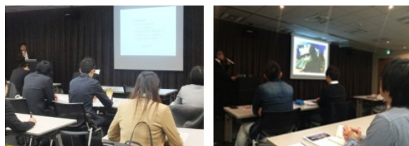
過去の説明会・選考会の様子

今後も、当社ミッションである「プロフェッショナルの生涯価値の向上」を実現するべく、クリエイティブ分野で働く方々にとって有益となるセミナーやイベントを開催してまいります。