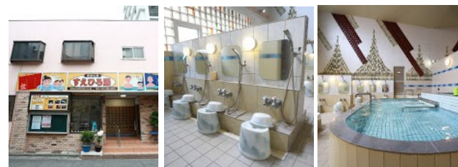
寿恵弘湯(川崎市川崎区大師駅前)

昭和31年の黒湯の掘削以来、50年以上枯れることなく湧き出している天然温泉(ナトリウム炭酸水素塩泉)が自慢の銭湯です。黒湯は色が非常に濃く、湯あたりが滑らかで、入浴後もなかなか湯冷めしないという特徴があります。脱衣場にはジャズが流れ、浴室内にはスチームサウナ(無料)と涼み場も完備。大広間では新年会も開催可能です。