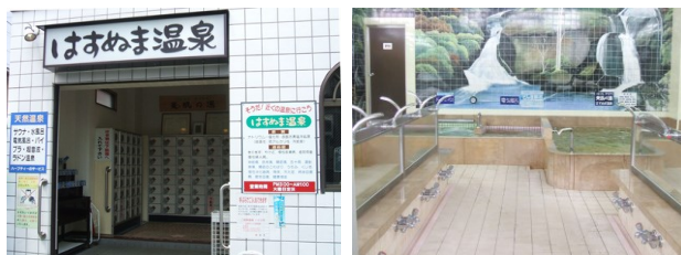
はすぬま温泉(川崎市中原区)

淡黄褐色透明の温泉に、源泉かけ流しの水風呂(19℃)、ラドン泉を使用した電気風呂や、マッサージ効果抜群の超音波風呂など設備も充実。無料のドライサウナやマッサージ器(女湯のみ)、湯上がりのハーブティーのサービスも好評です。男湯・女湯にまたがる一面タイル貼りの背景画は壮観です。