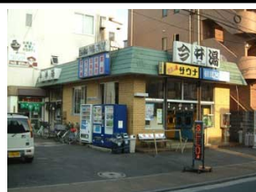
今井湯(川崎市中原区)