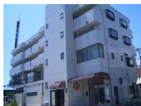
鈴の湯(川崎市高津区)