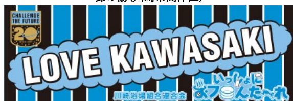
おフロんた～れタオル(2015年度版)