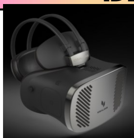
「IDEALENS K2」 ※オープン価格 ケーブルレス・スタンドアロン(一体)型のVR・HMD