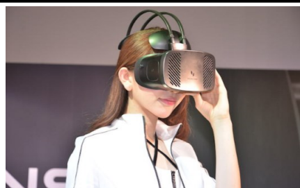
ケーブルレスで、着脱が容易。本体295gと軽量。