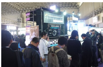
2016年11月「Inter BEE 2016」のブースの様子 映像分野のプロがアイデアレンズの体験に列をなしました。