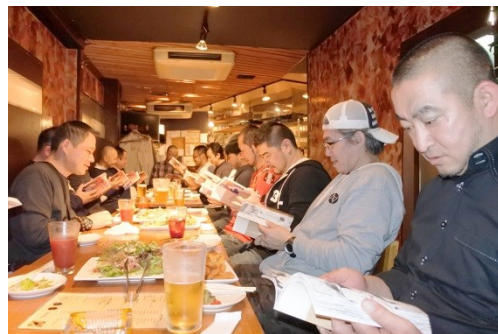
コミック冊子『19 FOREVER』が手渡され 皆さま一斉に無言でよみふけります