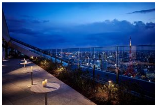
本大会の懇親会場になるアンダーズ 東京 52階 ルーフトップ スタジオ

■イベント名 ポケモン企業対抗戦 https://www.pokemon.co.jp/sp/fight_company/