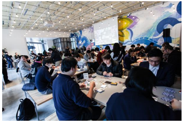
2018年12月ポケモンカードゲーム企業対抗戦の様子@新虎通りCORE