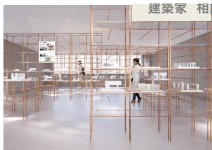
相談ブースの展示イメージ