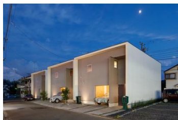
「STAPLE HOUSE® KOGASAKA」