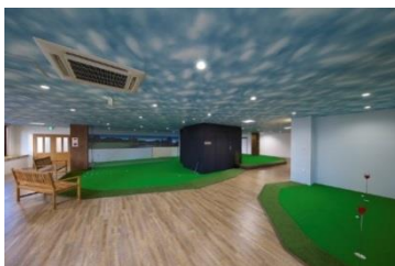
「GOLF LiViNG KOGA」