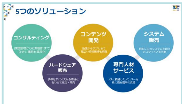
C&R社のXRサービスラインナップ

出展URL ▶ https://nextech-at2021.tems-system.com/eguide/jp/XRA/details?id=175