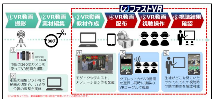
VRコンテンツオーサリングサービス「ファストVR」