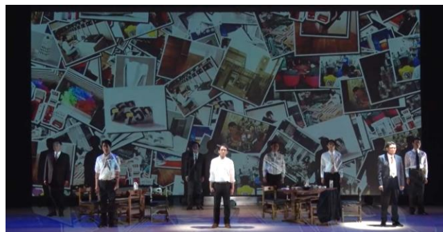
2021年9月10日(金)東京「イイノホール」にて無観客上演

すでに鑑賞した社員からは、「忘れていた新入社員の頃の思いを取り戻した。新しい感覚で業務に取り組みたい」「歴史を知ることで過去から挑戦をし続けてきた会社なんだと改めて感じた」「上司や同僚と仕事の価値について語り合いたいと思った」など、通常の研修では得られない感想が寄せられました。大日本印刷労組では、本演劇による研修で従業員同士の感想共有による一体感の醸成やモチベーション向上の相乗効果を期待していると、感想をいただいております。