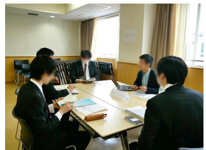
「内定直結型 修士・博士・ポスドクのための就職セミナー」 2017年3月開催の様子

当社のプロフェッサー事業部は、2015年10月より本格的に事業を開始。IT、機械、繊維、化学、化粧品、製薬企業や研究施設など約150社(機関)とネットワークを構築するとともに、研究者や研究プロジェクトの橋渡しを行い、多くのプロジェクトを成立させてまいりました。また、当社は1990年の設立以来、クリエイター、ITエンジニア、医師、弁護士、会計士、建築士、ファッション、研究者、シェフなどのプロフェッショナルに特化したエージェンシーを、次々と立ち上げてまいりました。当社理念である「プロフェッショナルの生涯価値の向上」と「クライアント企業の価値の創造」を実現に向けて、エージェンシー事業を知能の50分野に展開し、「プロフェッショナルによる豊かな社会の実現」に貢献してまいります。