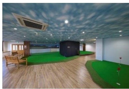
GOLF LiViNG KOGA