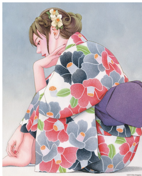
きたがわ翔 初原画展 アナログ