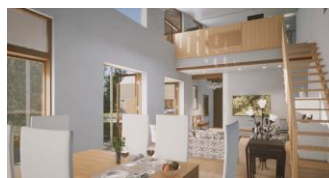
個別モデルハウスの画像からワープして内部へ