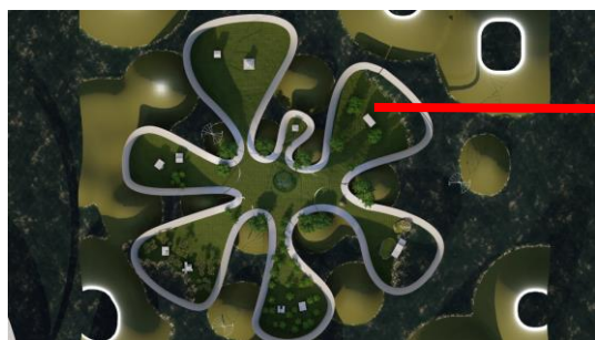
VRモデルハウスをカテゴリごとに配置