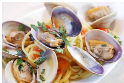
大粒アサリのボンゴレビアンコ 1,960円(税込)