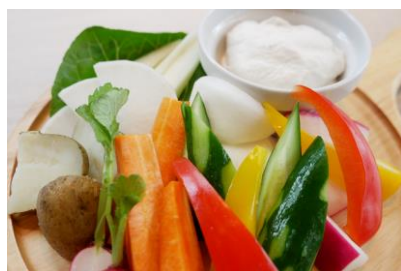
バーニャレイダ 1,320円(税込)