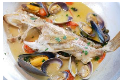
函館直送魚介のアクアパッツァ 2,150円(税込)