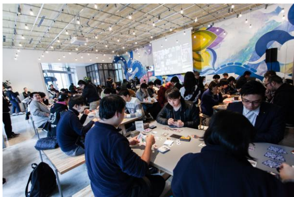
2018年12月ポケモンカードゲーム企業対抗戦の様子@新虎通りCORE