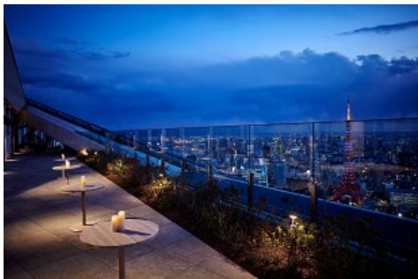
アンダーズ 東京 52階 ルーフトップ スタジオ

©2019 Pokémon. ©1995-2019 Nintendo/Creatures Inc./GAME FREAK inc. ポケットモンスター・ポケモン・Pokémonは任天堂・クリーチャーズ・ゲームフリークの登録商標です。Nintendo Switchは任天堂の商標です。