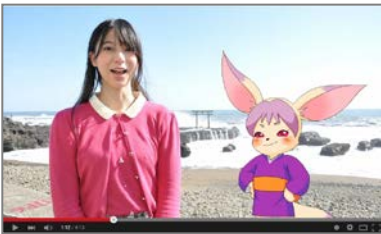
方言アフレコ体験教室で使用した動画

当社は当事業の一環として、被災地の中から青森県八戸市、岩手県釜石市、宮城県仙台市、福島県福島市、茨城県東茨城郡大洗町の5カ所の方言を取りあげ、被災地地域の方言に親しむための動画を制作し、平成25年度に当社が制作した文化庁Webページ「方言アフレコ体験教室(*ii)」として公開いたしました。また、前述の各地域で小学生から高校生までを対象に「方言アフレコ体験ワークショップ」を開催。プロの声優の指導のもと、制作した動画に合わせて方言を用いたアフレコ体験を実施し、子供たちに楽しく方言に親しむ機会を提供いたしました。