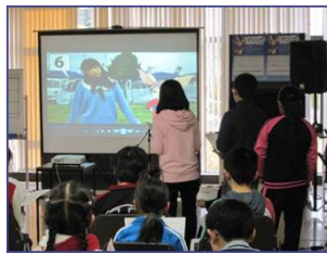
方言アフレコ体験教室の様子