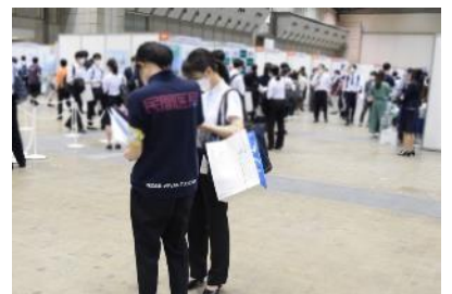
ブース訪問サポーター