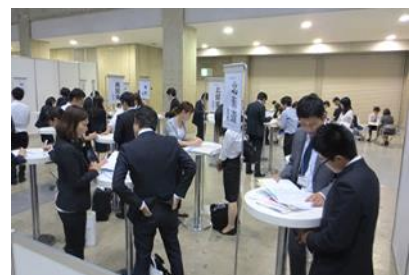
医学生キャリアなんでも相談コーナー