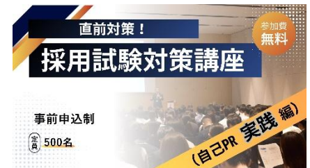
採用試験対策講座セミナーイメージ