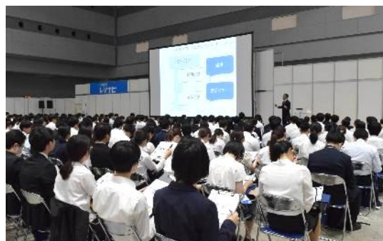
「レジナビフェア2025東京」セミナーの様子