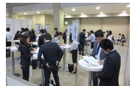
医学生キャリアなんでも相談コーナー

今後のキャリアや悩み事など、じっくり相談に乗ってほしい医学生に向けて、ドクターのキャリア支援をしているエージェントがお答えします。