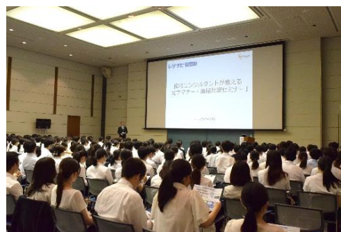
「レジナビフェア2025大阪」セミナーの様子