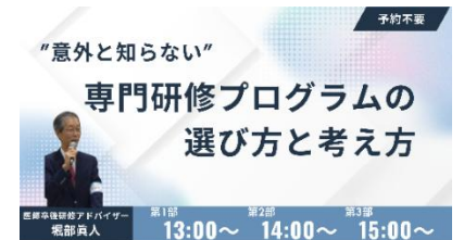
専門研修プログラムの選び方と考え方ミニセミナーイメージ

補足：申し込みの事前予約は不要です。1回20分程度のセミナーですので、お気軽にご参加ください。