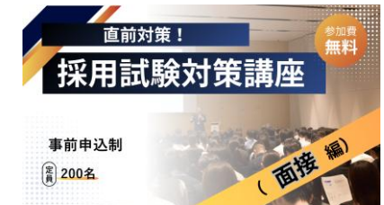
採用試験対策講座セミナーイメージ