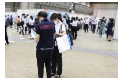
ブース訪問サポーター

初期研修医を対象に、キャリア相談を行っている社員が研修病院探しのお手伝いをします。本企画は事前予約制となりますので、7月1日(水)の締切までに、レジナビWebに掲載している レジナビフェア大阪 の「研修医相談コーナー」概要内にある「当社エージェントへの相談事前予約」のボタンからお申し込み下さい。